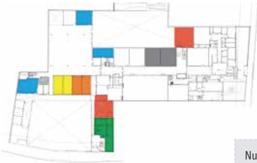
◀ Distribución de Educación Inicial para el año 2019.

Con motivo de la construcción del nuevo edificio destinado a Educación Inicial, hemos asignado para ese sector la utilización de los salones ubicados en el patio techado de planta baja. El nivel de 2 años permanece con el uso exclusivo de la casa de Montero.